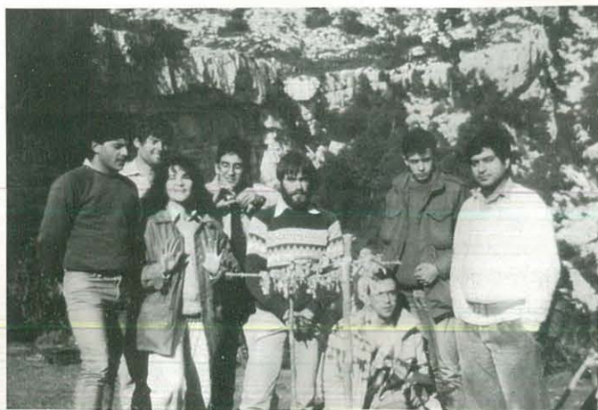
Supervivència "Cova del Vidre"

El nostre destí fou una pista que és passat un poble anomenat Alos d'Isil. El viatge ens va costar unes 7 hores de pujada i les mateixes de baixada, tenint en compte que pujant varem trobar boira i baixant pluja. També varem passar al poble d'Esterrí d'Àneu per fer turisme i comprar algunes coses.