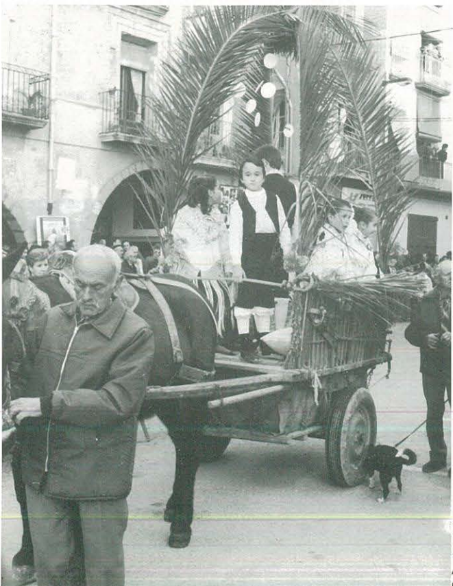
Carrossa de Sant Antoni

El dia 18 de gener vam celebrar la festa dels animalets... i pocs van faltar a la cita.