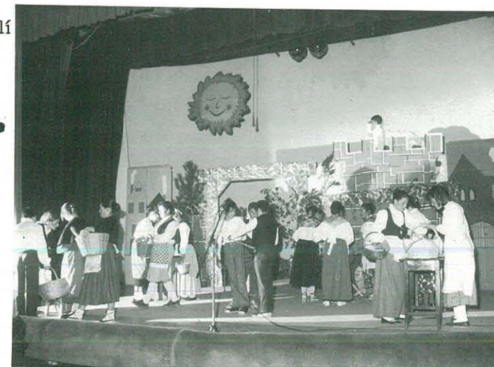
Representació de l'obra de Teatre "Les Armes de Bagatel.la"

Classe 4rt. "B" Pàrvuls de 4 anys "A" Pàrvuls de 4 anys "B" Pàrvuls de 5 anys "A" Pàrvuls de 5 anys "B"