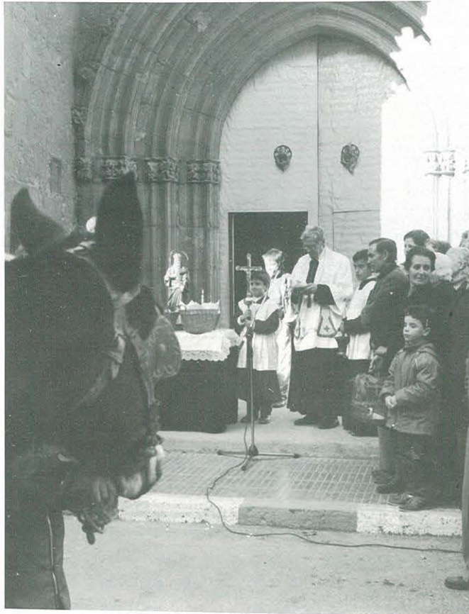
Benedicció dels animals