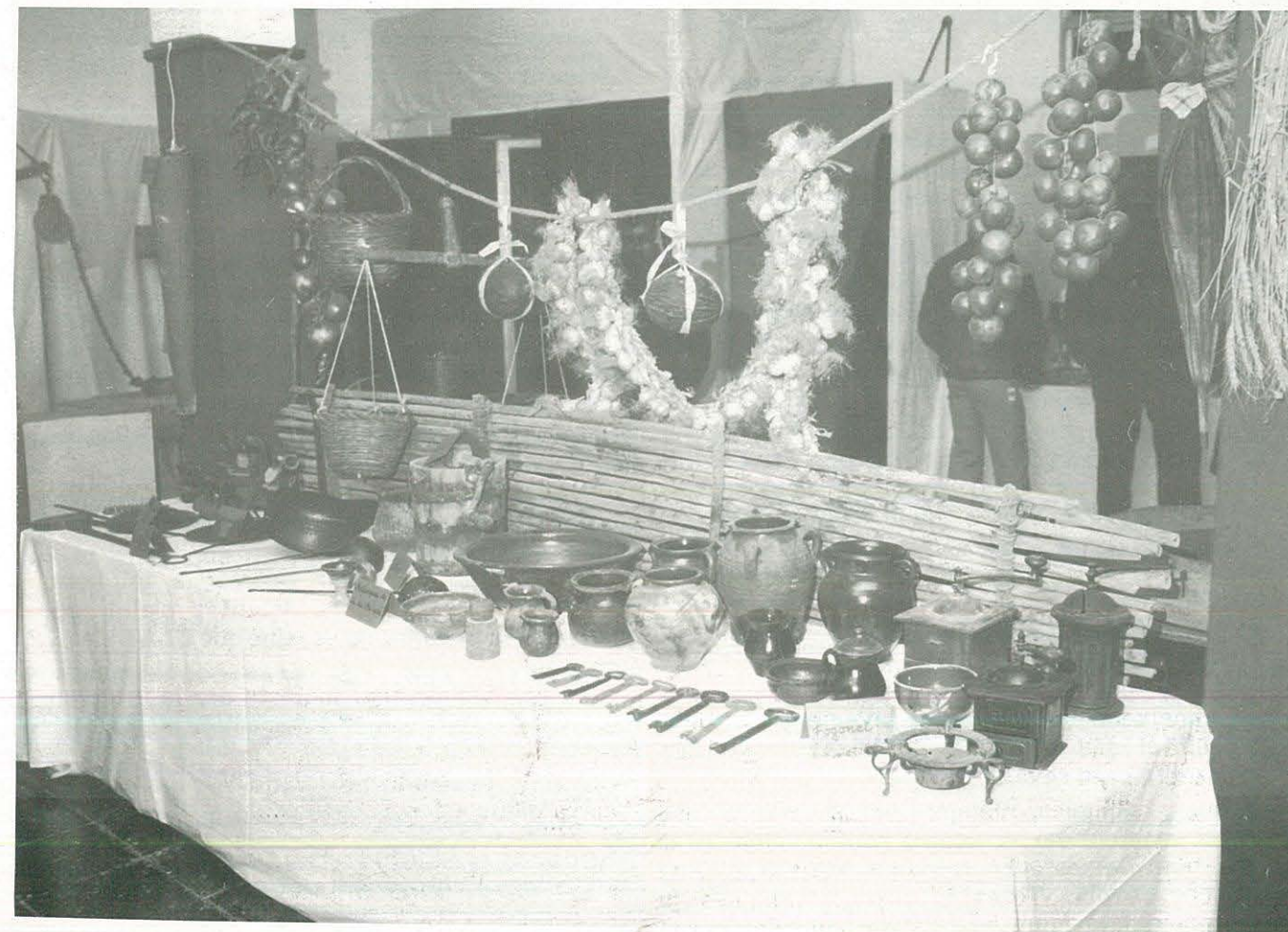
EXPOSICIÓ DE COSES ANTIGUES