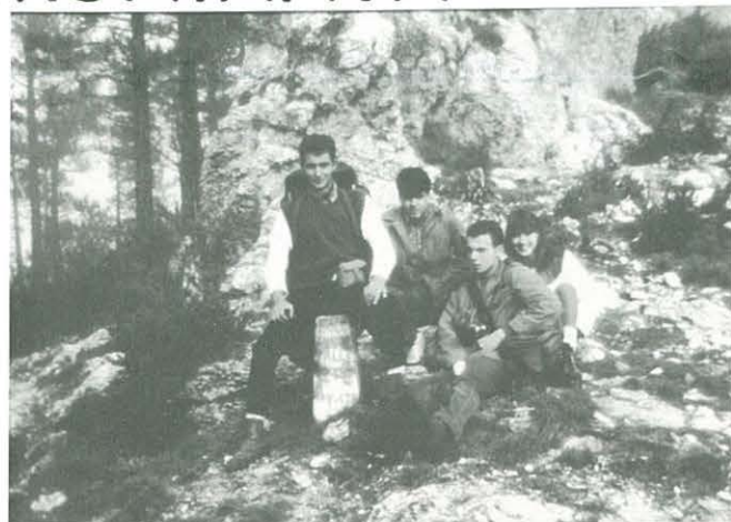
Acampada "Cova del Vidre"

4rt.- Muntatge d'un assecador de carn, realitzat amb rames, orientant-lo cap al sol i l'aire, havent tallat anteriorment un pollastre en fines làmines de carn per a realitzar l'operació amb èxit.