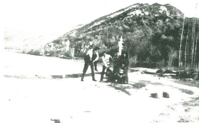
Acampada al Pirineu Català

Al campament teníem dues tendes isotèrmiques pertanyents al Centre, i una canadenc de 8 places que ens servia de menjador, propietat d'un dels membres de la Secció.